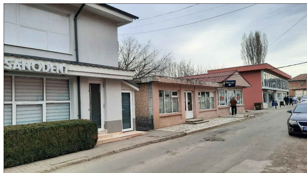
Desfasurator stradal - EXISTENT - 3D