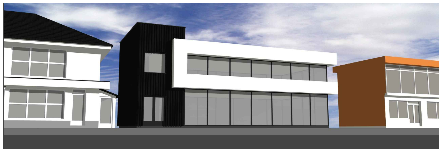
Desfasurator stradal - PROPUS - 3D